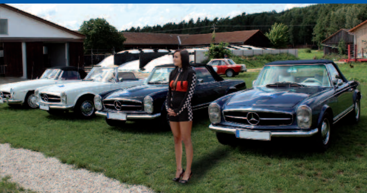
2013 – 50-jähriges Jubiläum: Mercedes SL „Pagode“