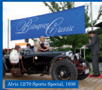
Alvis 12/70 Sports Special, 1938