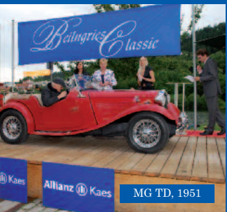
MG TD, 1951