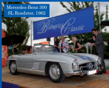
Mercedes-Benz 300 SL Roadster, 1962