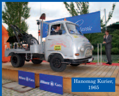
Hanomag Kurier, 1965