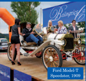
Ford Model-T Speedster, 1909