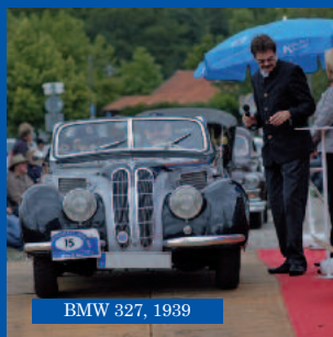
BMW 327, 1939