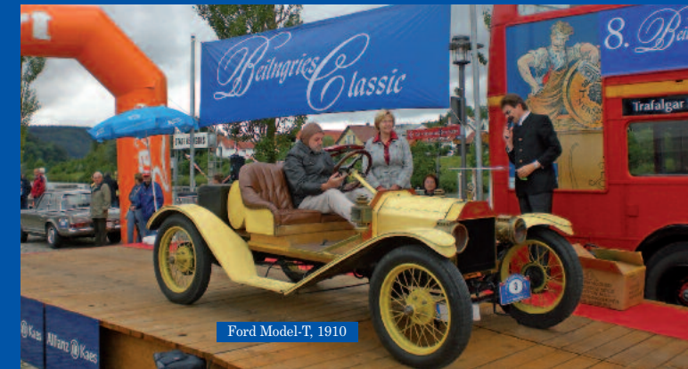
Ford Model-T, 1910