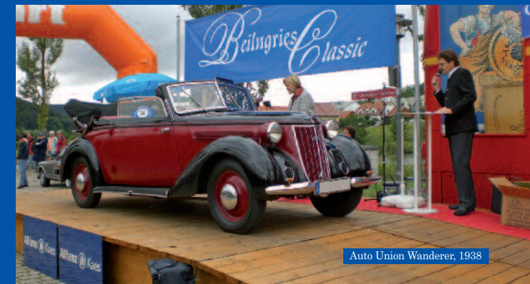
Auto Union Wanderer, 1938

Beilngrieser Altstadtfest: 17. und 18. Juli 2010