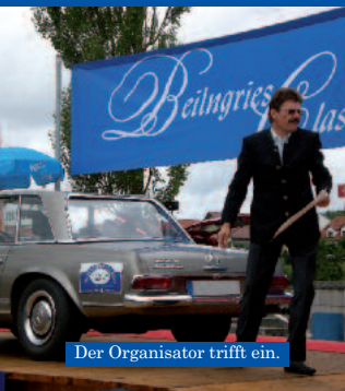
Der Organisator trifft ein.