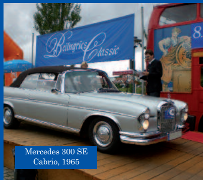
Mercedes 300 SE Cabrio, 1965