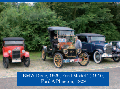
BMW Dixie, 1929, Ford Model-T, 1910, Ford A Phaeton, 1929