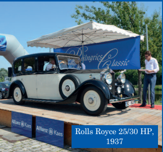
Rolls Royce 25/30 HP, 1937