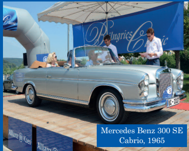
Mercedes Benz 300 SE Cabrio, 1965