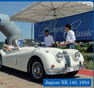
Jaguar XK 140, 1954