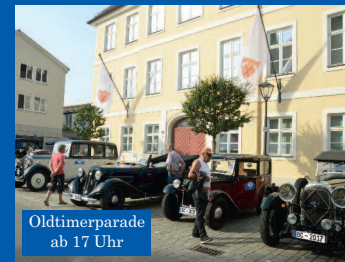
Oldtimerparade ab 17 Uhr