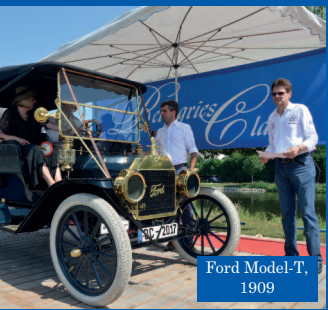
Ford Model-T, 1909