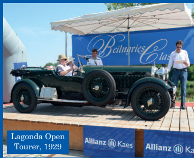
Lagonda Open Tourer, 1929