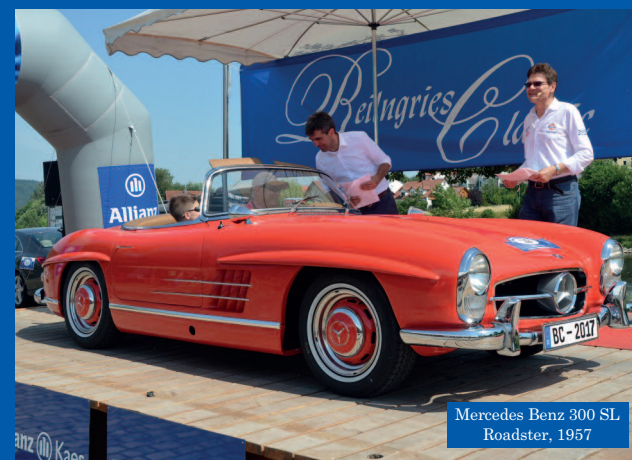
Mercedes Benz 300 SL Roadster, 1957

Beilngrieser Altstadtfest: 15. und 16. Juli 2017