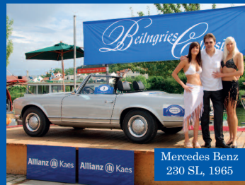
Mercedes Benz 230 SL, 1965