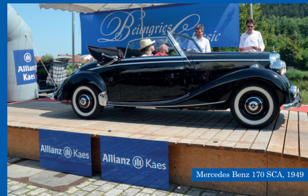
Mercedes Benz 170 SCA, 1949