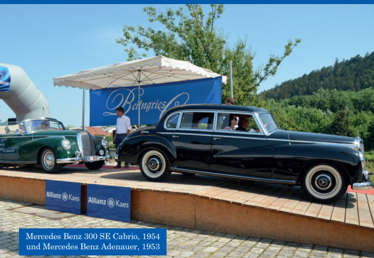
Mercedes Benz 300 SE Cabrio, 1954 und Mercedes Benz Adenauer, 1953

Die BEILNGRIES CLASSIC findet seit 2001 statt, seit 2012 im jährlichen Wechsel mit der Franz Xaver Uhl Classic.