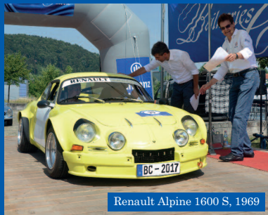
Renault Alpine 1600 S, 1969