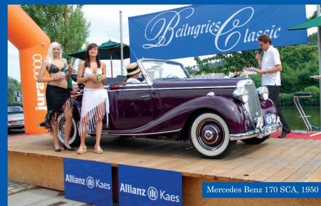
Mercedes Benz 170 SCA, 1950