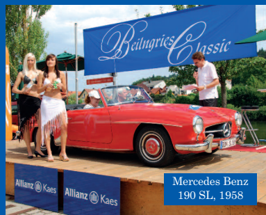
Mercedes Benz 190 SL, 1958