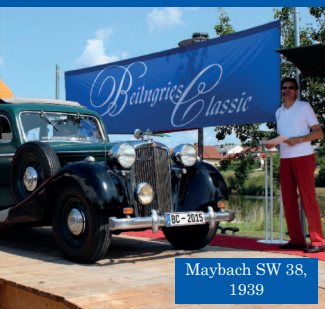
Maybach SW 38, 1939