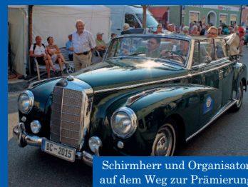
Schirmherr und Organisator auf dem Weg zur Prämierung