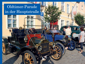
Oldtimer-Parade in der Hauptstraße