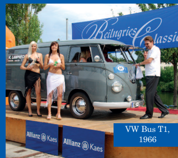
VW Bus T1, 1966