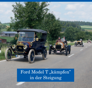
Ford Model T „kämpfen“ in der Steigung