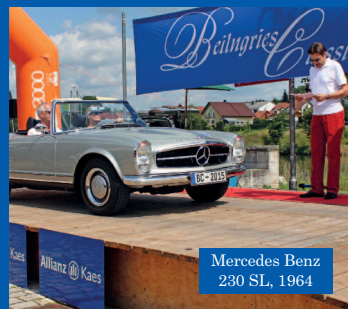
Mercedes Benz 230 SL, 1964