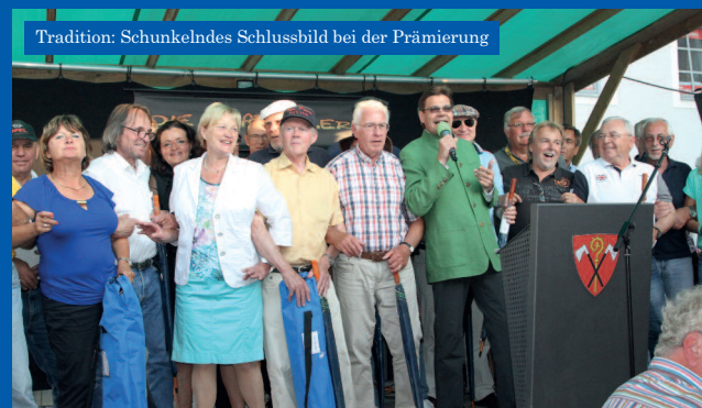
Tradition: Schunkelndes Schlussbild bei der Prämierung

Stimmung bei Livemusik im Event-Zelt und in den Gastronomiebetrieben in der Hauptstraße